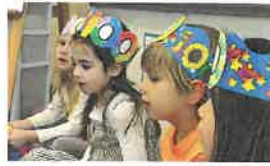
CELEBRACIÓN DE LOS 100 DÍAS TRADICIÓN