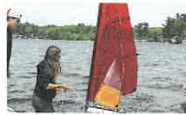
CONSTRUCCIÓN DE ROBOTS DE NAVEGACIÓN INNOVACIÓN