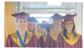
ADELANTE Y MÁS ALLÁ GRADUADOS DEL NHS ORGULLO CLIPPER