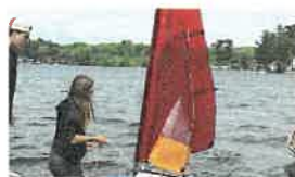
CONSTRUINDO ROBÔS VELEJADORES INOVAÇÃO