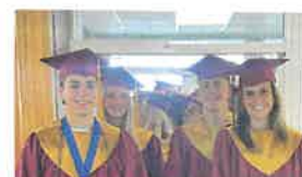
GRADUADOS NHS, SEGUINDO EM FRENTE PARA SEMPRE ORGULHO CLIPPER