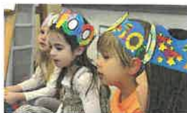
CELEBRANDO O 100º DIA TRADIÇÃO