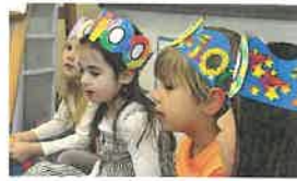
جشن صدمین روز ثقافت