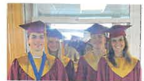
به پیش، و پیشروی فارغ التحصیلان NHS کلپبر پراید