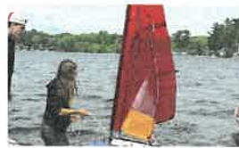
ساخت ربات های قایقرانی نوآوری